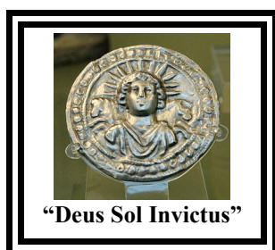
“Deus Sol Invictus”

-A tutti Risp.:mi Fratelli MM.: appartenenti all'A.:P.:R.:M.:M.: in Italia e all'Estero.